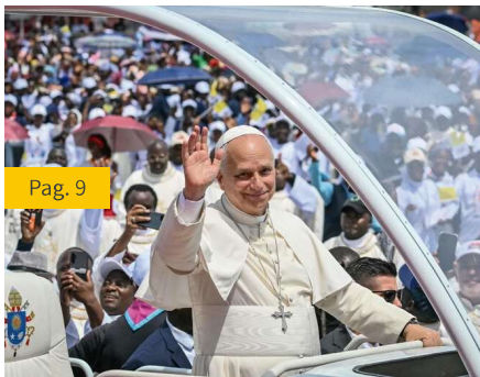
Papa Leão XIV em Angola