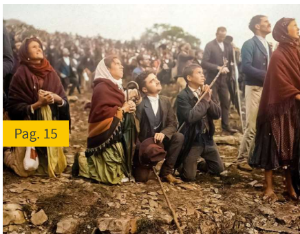
Milagre de Fátima